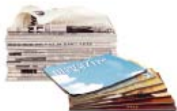
Les journaux et magazines