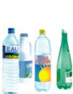
seuls ces plastiques sont recyclables

Les bouteilles en plastique (eau, jus de fruit, soda, lait, huile...)