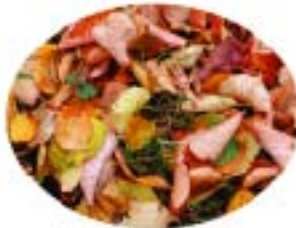
Fleurs fanées, feuilles mortes, mauvaises herbes, petites branches et tailles, fagots d'un mètre*...

*fermés par des liens biodégradables (pas de liens en plastique ni de fil de fer)