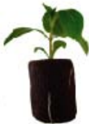
Plantes avec terre