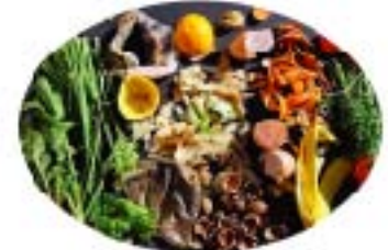
Fruits et légumes abîmés, épluchures, restes de pain